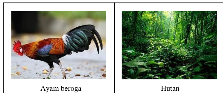
Rajah 1: Imej binaan frasa data 1